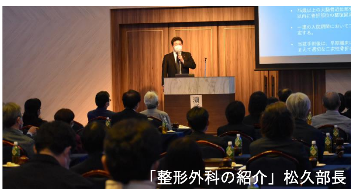
「整形外科の紹介」松久部長