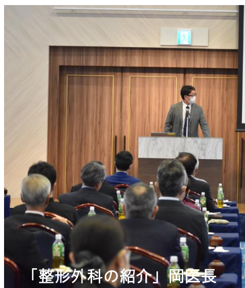
「整形外科の紹介」岡医長